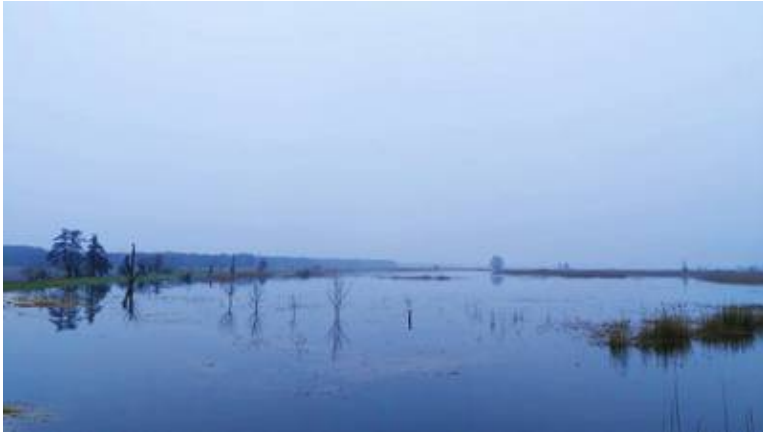
Oderbruch (Schwäne abgereist)

Singschwäne sind Brutvögel der osteuropäischen und sibirischen Taiga. Im Herbst und Winter sind diese Schwäne auch in Mitteleuropa zu beobachten. In Küstengebieten und im norddeutschen Tiefland sind sie regelmäßiger Wintergast. Zunehmend kommt es aber auch zu Übersommerungen und vereinzelt Brut in Mitteleuropa. Der Zug aus den Wintergebieten setzt im Oktober ein. Sie kehren ab März in ihre Brutgebiete zurück (Aufnahme März 2024, Gertrud M.)