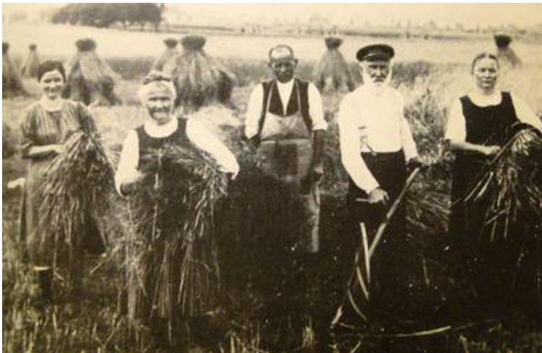
Mit der Sense mähen 1910